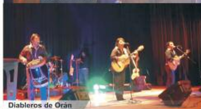
Diablos de Orán